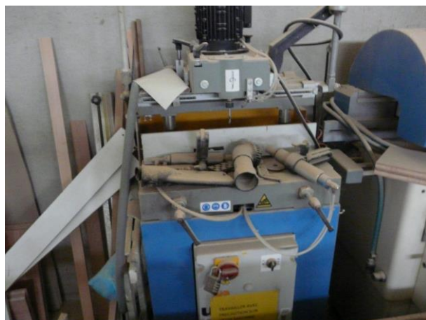
Sertisseuse à profils aluminium FC100AP