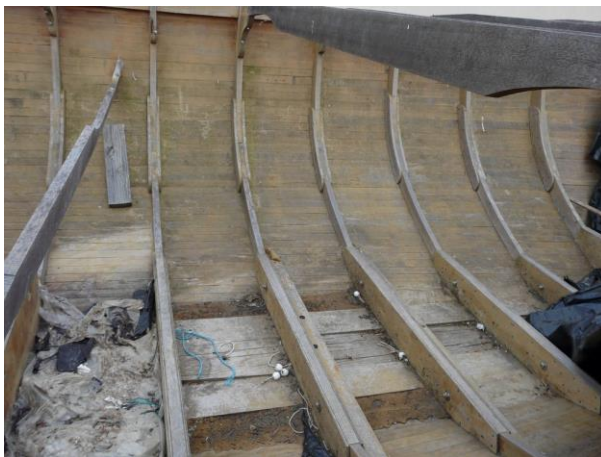
Coque voilier non pontée bois fibrée résinée longueur 8.50 m environ

VISITE A 09 HEURES LISTE DETAILLEE SUR HUISSIER11.COM vente aux enchères Liste indicative sous réserve d'erreur ou d'omission, biens proposés en l'état, sans garantie. PAIEMENT COMPTANT, CHEQUE DE BANQUE OU CB ENLEVEMENT IMMEDIAT (sauf cas particuliers) FRAIS : 14.4% TTC