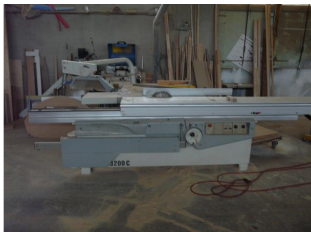
Scie à panneau 5M SICAR EXPRESS 3200C