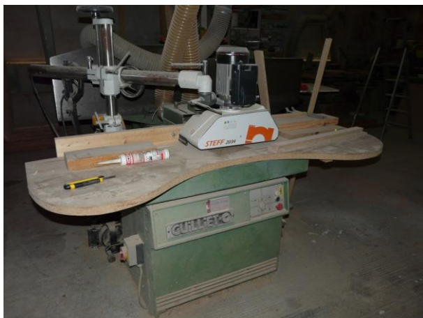
Toupies avec entraîneuses