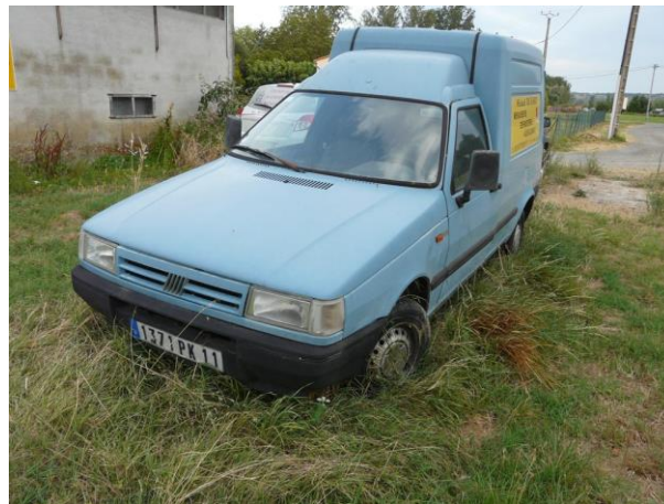
Fiat PUNTO camionnette