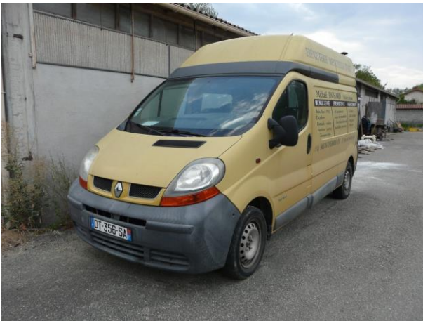
Renault TRAFFIC 2003 - 323000 km