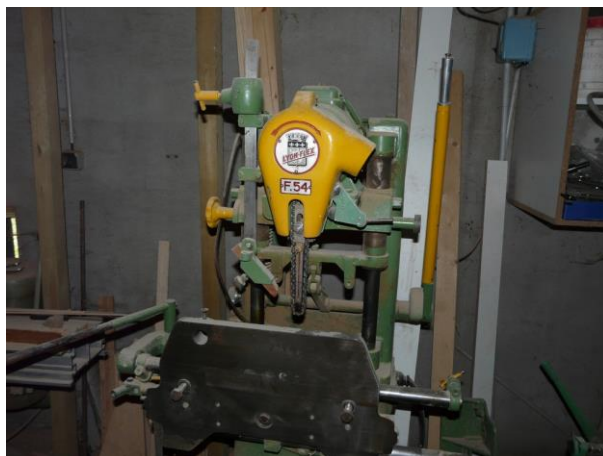
mortaiseuses à bédane et à chaînes