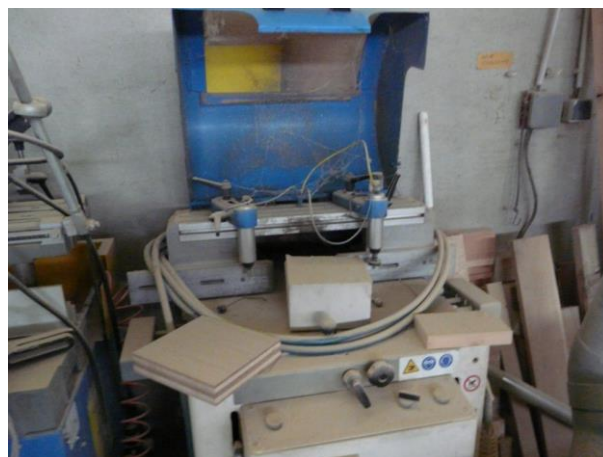
Fraise MECAL AS400P