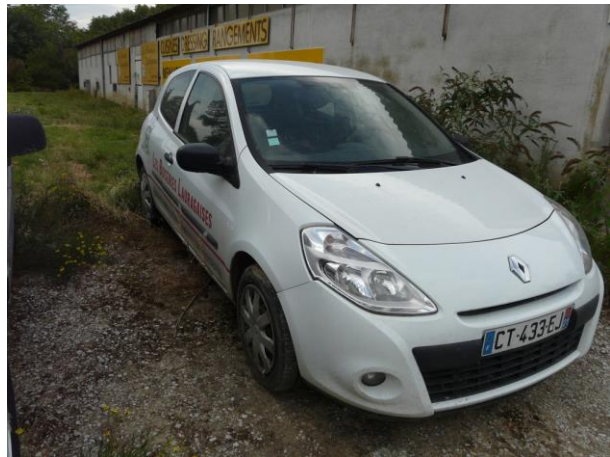
Renault CLIO (sté) 2013 – 219000 km