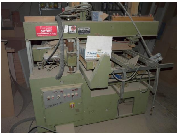
Multibroches FORECAM 50