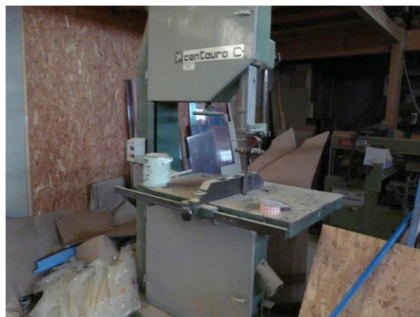
scie à rubanCENTAURO