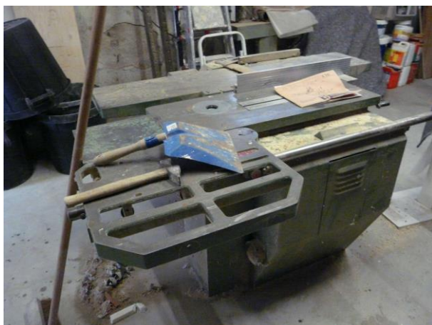
Combiné complète ROBLAND K310