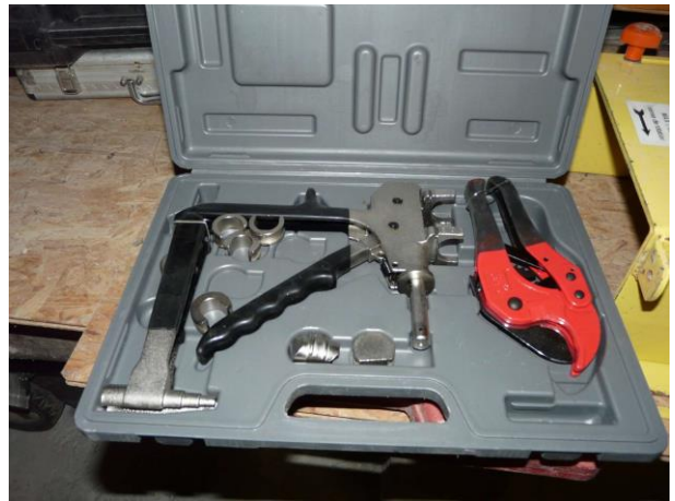
Mallettes de sertissage