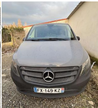
MERCEDES VITO 2021 147.000 KM ENV.