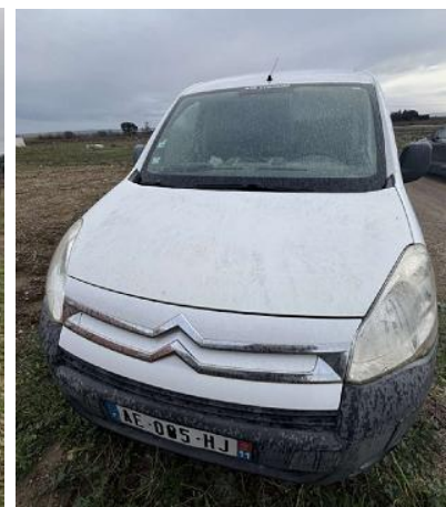
CITROEN BERLINGO ANNEE 2009 190.000 KM ENV

VISITE 1/2 HEURE AVANT LA VENTE LISTE DETAILLEE SUR www.auxiliajuris.fr rubrique « vente aux enchères » Liste indicative sous réserve d'erreur ou d'omission, biens proposés en l'état, sans garantie. PAIEMENT COMPTANT, CHEQUE DE BANQUE OU CB ENLEVEMENT IMMEDIAT (sauf cas particuliers) FRAIS : 14.28% TTC