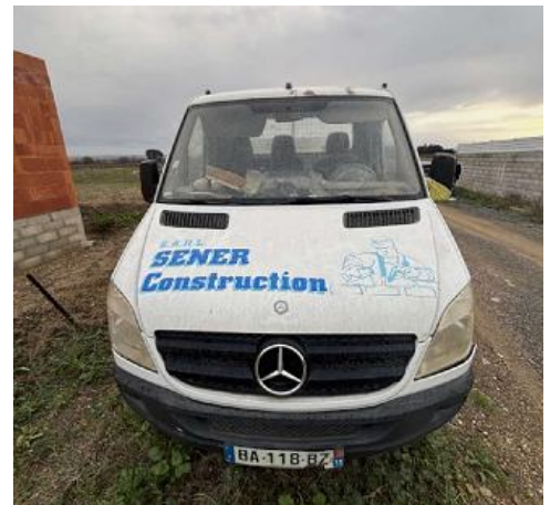
MERCEDES BENNE ANNEE 2008 327.000 KM ENV.